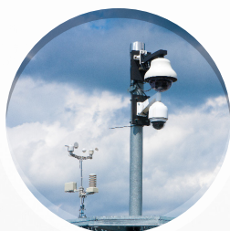
TRACCIAMENTO PTZ STAND ALONE