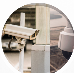
TRACCIAMENTO PTZ PLUG IN